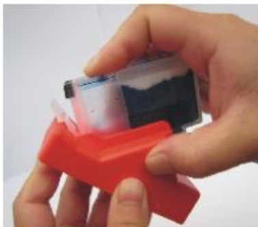
Vastdrukken tot lichtje continue brand