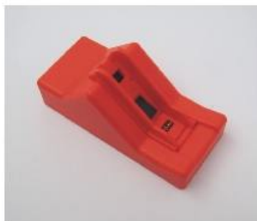
Met adapter voor CLI-8 serie (smalle cartridges)