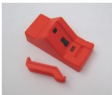
Zonder adapter voor PGI-5 Zwart (brede cartridge)