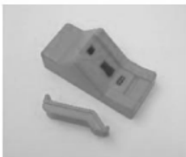
Zonder adapter voor (brede cartridge)