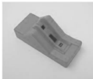
Met adapter voor (smalle cartridges)

Zorg ervoor dat er goed contact wordt gemaakt met de contactpuntjes