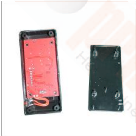
3 Cover open