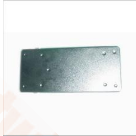
10 Met wat secondenlijm kunt u de onderkant weer terugplaatsen. Gereed!