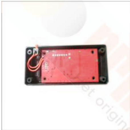
9 Plaats het printplaatje terug in de houder