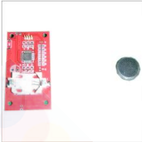
7 Batterij verwijderd