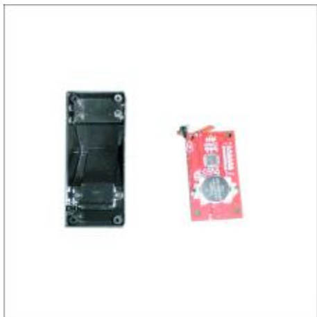
5 Printplaatje uit de resetter