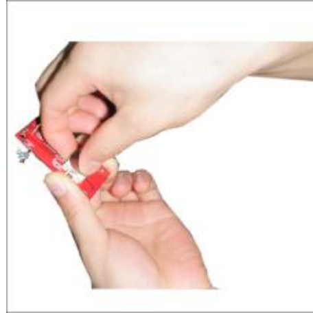
8 Plaats een nieuw batterijtje op de plaats van de oude.