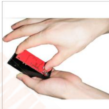
4 Haal het printplaatje voorzichtig uit de resetter