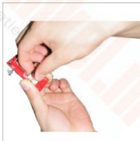
6 Haal het batterijtje van het printplaatje af.