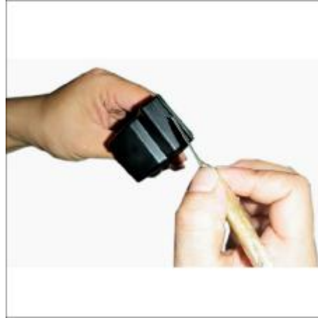
2 Gebruik een mesje om de onderkant te openen