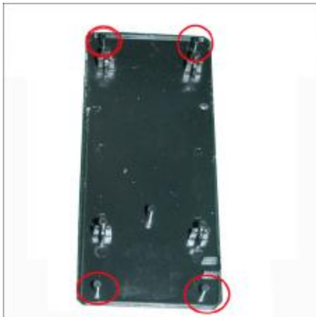
Let op dat u de palletjes op de cover niet afbreekt.